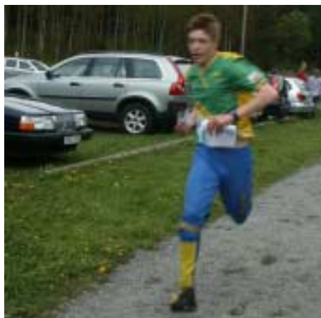
För snabb för automatskärapa!

Beskriv dig själv: Uthållig, stark, snäll, duktig!...nästan 180 cm lång, brunt (brunnrött) hår.