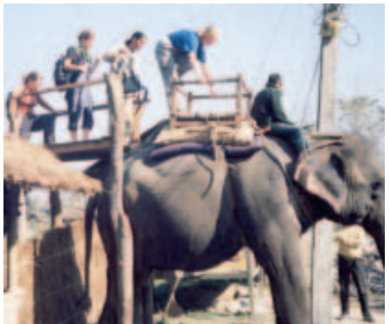
Kanske säkrare än buss?

Vi stannade en dag i Madras innan vi tog tåget vidare norrut. Att åka tåg i Indien är ett äventyr i sig. För att köpa biljetter måste man fylla i en lapp med tågnummer, destination, antal personer, namn på personerna, vilken klass man ska åka samt adress. Denna lapp får man från en lucka dit man måste köa. Lappen ska sedan lämnas in i en annan lucka för att kunna köpa våra biljetter. Det