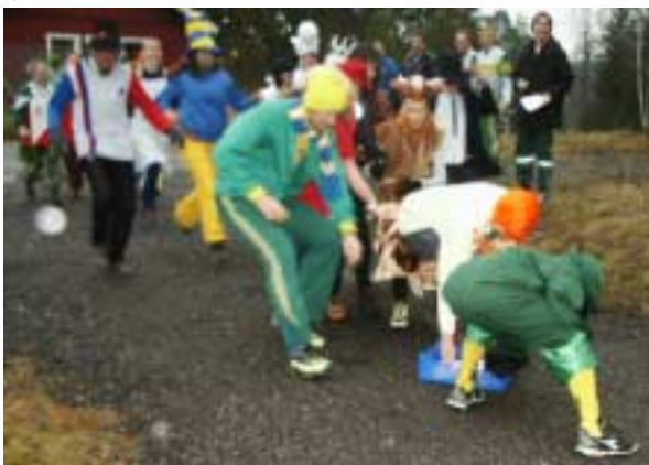
Starten där snabbast fick en blindkarta.