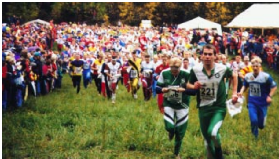
Maffig start på 25-manna.