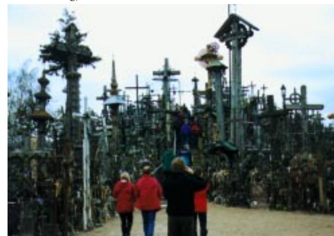
Utöver all orientering hann vi även besöka flera sevärigheter, som t.ex. Stora korsberget i Lettland.

Väl framme i Finland tog vi in på ett vandrarhem. Tävlingen var visserligen fyndig men den var uselt arrangerad. Samtliga kontroller fanns med på en karta och av det blev det tre slingor. Problemet var att kartan blev så rörig att den påminde om en mus som hade kommit för nära en mixer. Efter tävlingen fick vi titta upp på IOF:s huvudkontor och där var det dötråkigt. Efter det fick vi se nordiska mästerskapen i terränglöpning med betoning på platt grusvägslöpning. Det var inte så där jättehopp. Sedan var det bara båten hem till Stockholm och det är jag säker på att jag inte behöver skriva om. Sådär helt apropå var det fest varje kväll på resan. Vill ni se liveshower av resan så får ni följa med nästa år.